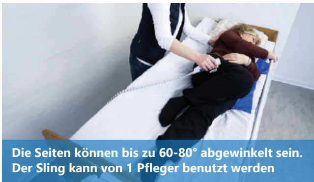
Die Seiten können bis zu 60-80° abgewinkelt sein. Der Sling kann von 1 Pfleger benutzt werden