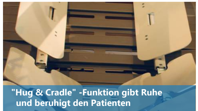
"Hug & Cradle" -Funktion gibt Ruhe und beruhigt den Patienten