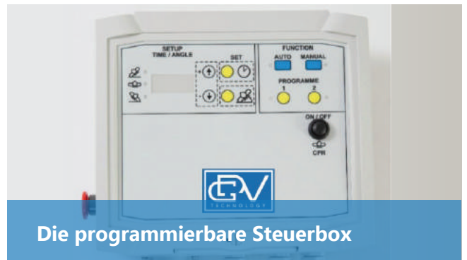
Die programmierbare Steuerbox