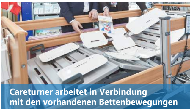
Careturmer arbeitet in Verbindung mit den vorhandenen Bettenbewegungen

Careturmer ist TÜV-geprüft und zugelassen mit einem Patientengewicht von bis zu 165 kg.